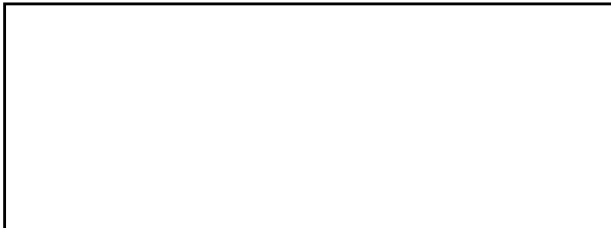
表 4 *****