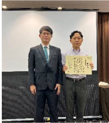
写真) 2025 年度環境情報科学センター賞表彰式の様子

環境情報科学センター賞は、環境情報科学に関する学問及び技術の進歩発展について貢献したと認められる学術論文、計画・設計、技術開発等の優れた業績に対して贈られます。本賞はこれまでに約 80 件近くの優れた研究業績や事業に対し授与されてきました。